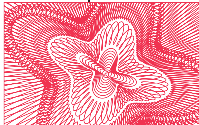
0.2 мм - лучше, но все равно плохо